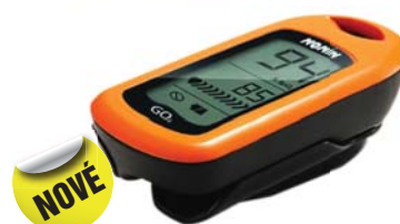
Prstový pulsní oxymetr NONIN 9570 GO 2