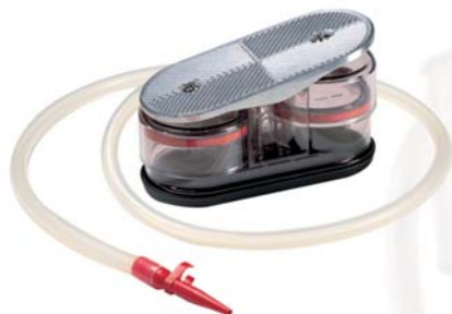
Manuální odsávačka Ambu