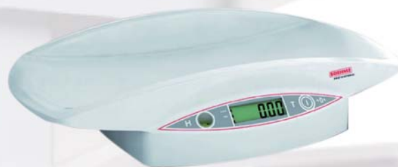
Elektrická kojenecká váha