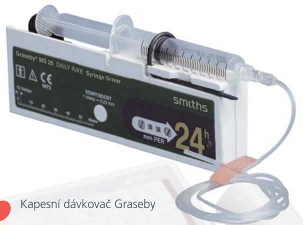
Kapesní dávkovač Graseby

PCA pumpa je určena k podávání léků tišících bolest pacientovi přesně podle intenzity bolesti. Pomocí PCA zařízení si pacient sám spouští aplikaci léku a určuje interval mezi aplikacemi. Kombinace lineárního dávkovače s PCA pumpou v sobě přináší velkou výhodu pro nemocniční zařízení.