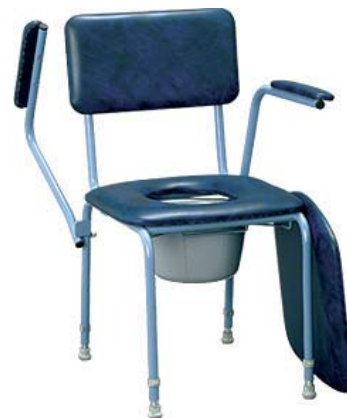
● Toaletní křeslo LUX