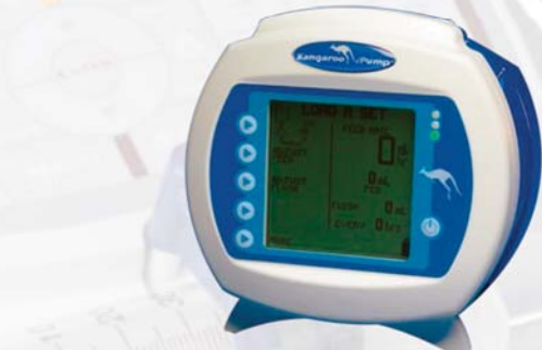
Pumpa pro enterální výživu Kangaroo