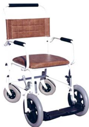
● Křeslo přepravní.