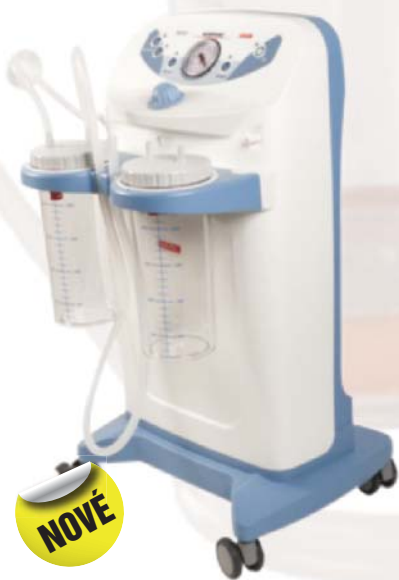
HOSPIVAC 350, 60 l/min, -90 kPa, operační sály, chirurgie, gynekoologie, liposukce