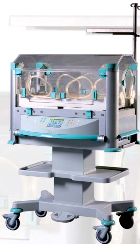
Novorozenecký stacionární inkubátor je určen pro standardní a intermediární péči o novorozence, poskytuje komfort, jednoduchou obsluhu a snadný přístup k novorozenci