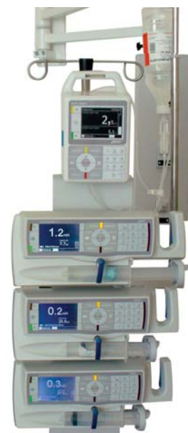
Infuzní pumpa TECHNIC II