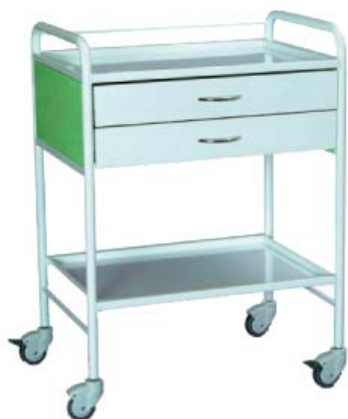
● Víceúčelový vozík.