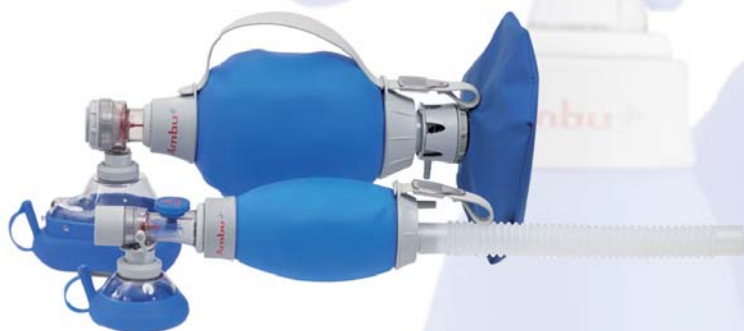
Ambu Mark IV a Mark Baby