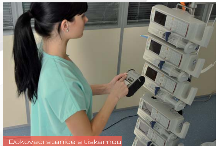
Dokovací stanice s tiskárnou