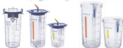
Systém pro jednorázové použití a opakované použití