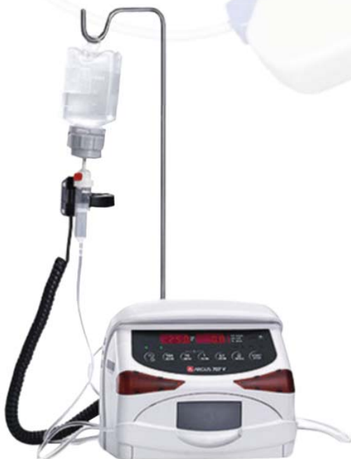
Argus A707 – infuzní pumpa