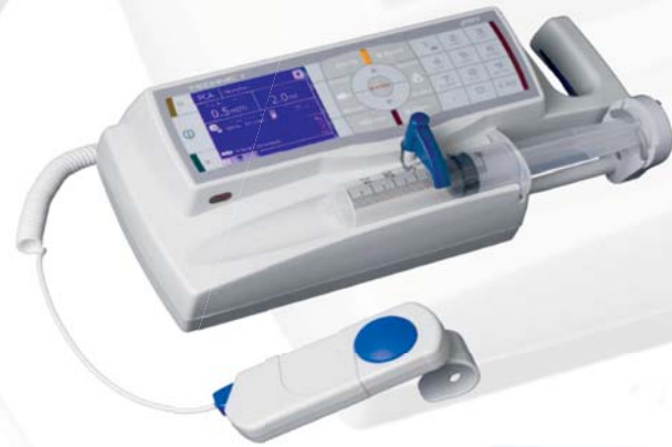
Injekční pumpa pro přesné dávkování farmak