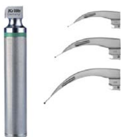
Laryngoskop macintosh – vlakno