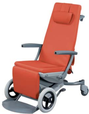
● Multifunkční křeslo Sella