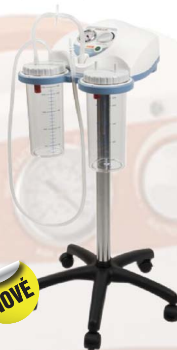
ASKIR C30, 40 l/min, -80 kPa ARO, JIP, lůžková oddělení