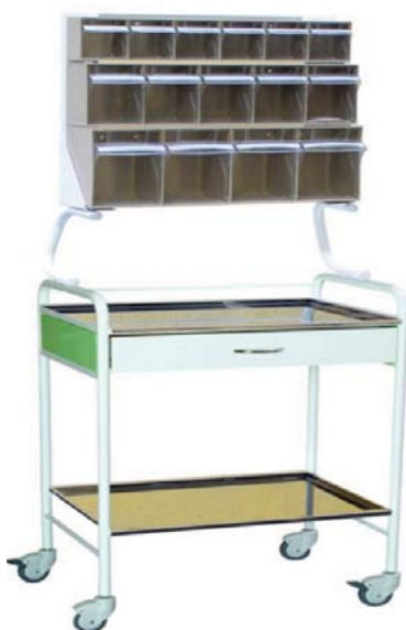
● Víceúčelový vozík s nádstavbou