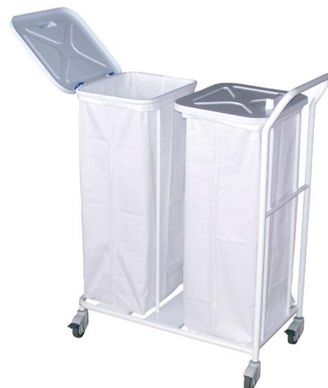
● Vozík na sběr použitého prádla