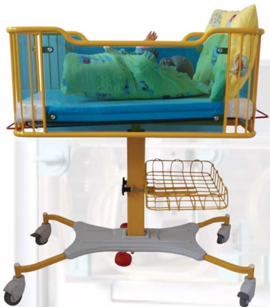
Novorozenecké lůžko LAURA