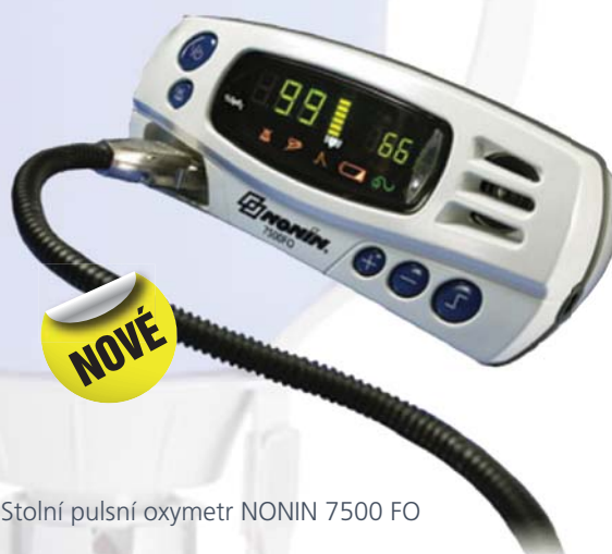
Stolní pulsní oxymetr NONIN 7500 FO