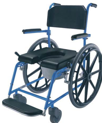
● Sprchový toaletní vozík